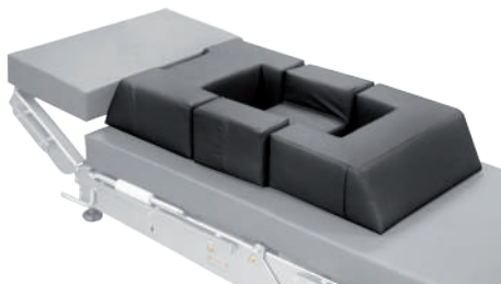
3. Подушка для спинальной хирургии КПП-39