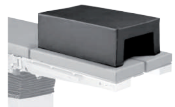
4. Подушка для ног пациента КПП-40