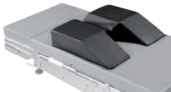
1. Подушка для позиционирования пациента на спине КПП-37