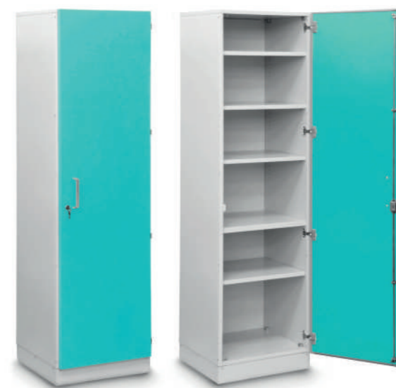
Шкаф медицинский высокий для хранения медикаментов (с полками)

Габариты (ш/г/в): - 300x600x2100 мм (707) - 450x600x2100 мм (705) - 600x600x2100 мм (701)