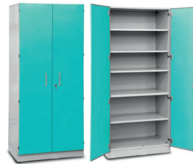
Шкаф медицинский высокий для хранения медикаментов (с полками)

Габариты (ш/г/в): - 300x600x2100 мм (707) - 450x600x2100 мм (705) - 600x600x2100 мм (701)