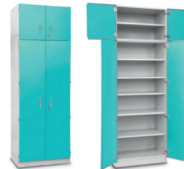
Шкаф медицинский высокий для хранения медикаментов (с полками и антресольным шкафом)

Габариты (ш/г/в): - 900x600x2700 мм (717)