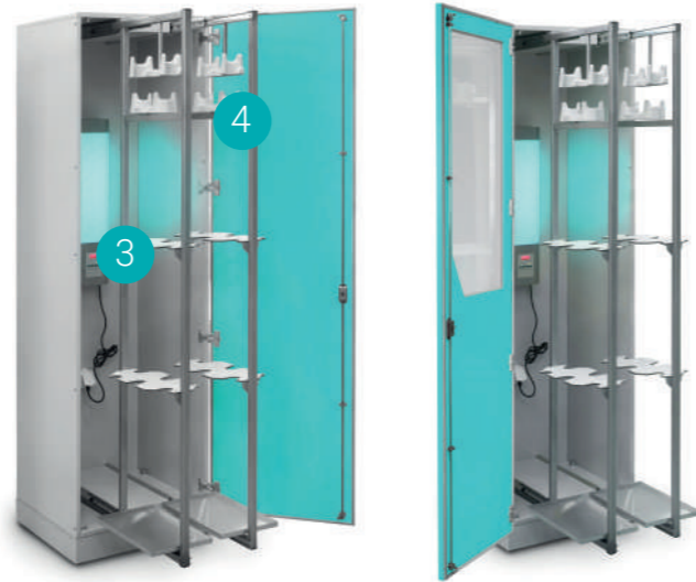
Шкаф медицинский высокий для хранения эндоскопов (740) для хранения эндоскопов (дверь со стеклом) (743)

Габариты (ш/г/в): - 300x600x2100 мм (715) - 600x600x2100 мм (711)