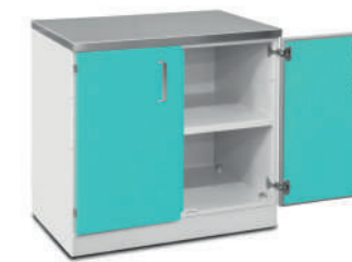
Шкаф медицинский нижний для хранения инструментов и перевязочного материала (с полками)

Габариты (ш/г/в): - 450x600x850 мм (724) - 600x600x850 мм (723)