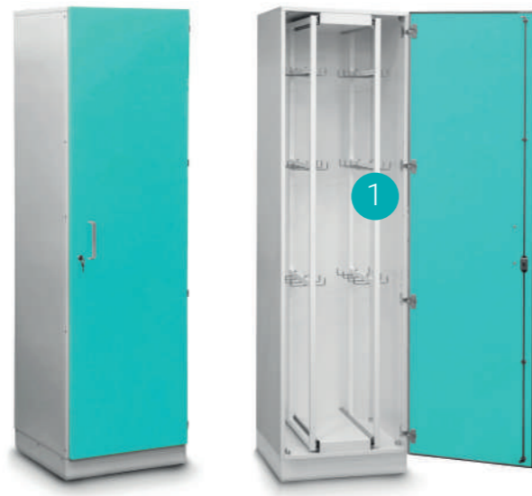
Шкаф медицинский высокий для хранения катетеров

Габариты (ш/г/в): - 600x600x2100 мм (710)