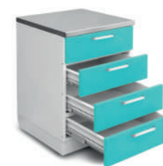
Шкаф медицинский нижний для медикаментов (с ящиками)

Габариты (ш/г/в): - 900x600x850 мм (725)