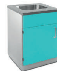
Шкаф медицинский нижний для установки мойки

Габариты (ш/г/в): - 900x600x850 мм (726)