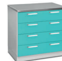
Шкаф медицинский нижний для медикаментов (с ящиками)

Габариты (ш/г/в): - 450x600x850 мм (728) - 600x600x850 мм (727)