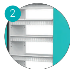
Регулируемые по высоте съемные лотки