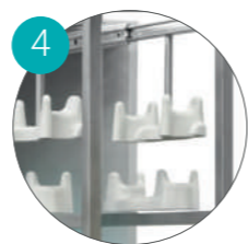
Размещение 8 эндоскопов одновременно