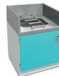
Шкаф медицинский нижний с больничным сливом

Габариты (ш/г/в): - 1200x600x850 мм (731) - 900x600x850 мм (738) Габариты мойки (ш/г/в): - 430x370x180 мм