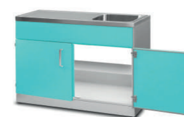
Шкаф медицинский нижний для установки гипсоотстойника

Габариты (ш/г/в): - 600x600x850 мм (732)