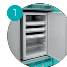
Встроенный холодильник (холодильник не входит в комплект поставки)

Габариты (ш/г/в): - 900x600x2700 мм (717)