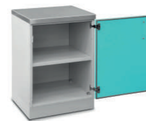
Шкаф медицинский нижний для хранения инструментов и перевязочного материала (с полками)

Габариты (ш/г/в): - 450x600x850 мм (724) - 600x600x850 мм (723)