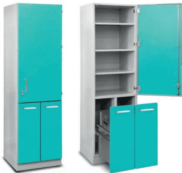
Шкаф медицинский высокий для хранения медикаментов (с выдвигаемыми секциями)

Габариты (ш/г/в): - 600x600x2100 мм (710)