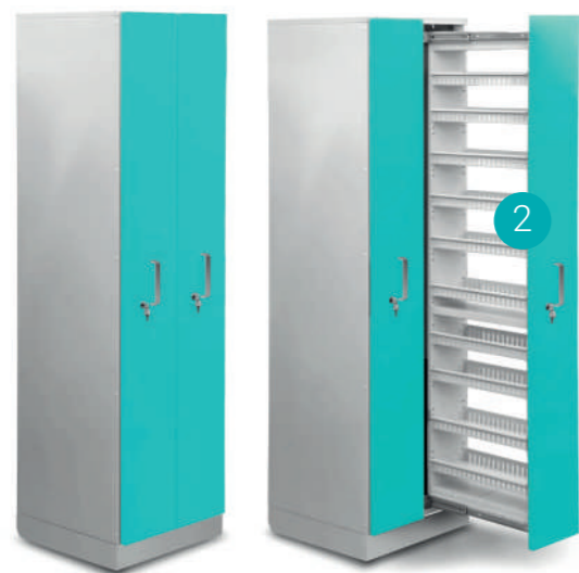
Шкаф медицинский высокий для хранения медикаментов

Габариты (ш/г/в): - 600x600x2100 мм (741)