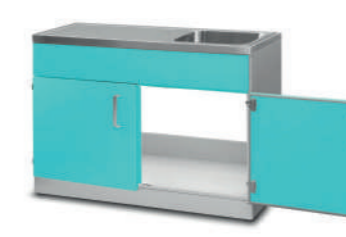
Шкаф медицинский нижний для установки мойки

Габариты (ш/г/в): - 600x600x850 мм (730) Габариты мойки (ш/г/в): - 430x370x180 мм