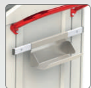
Держатель для полотенца