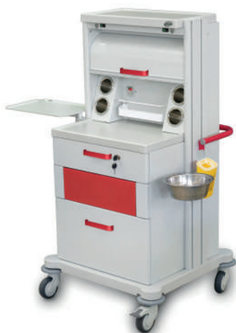
TM-8 (для гинекологического кабинета, инструментальная)