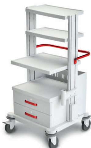
TM-9 (для гинекологического кабинета, приборная)