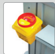
Контейнер для сбора использованного инструментария