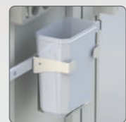
Контейнер для отходов