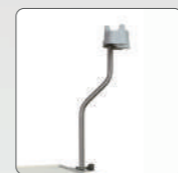
Держатель эндоскопов (кроме TM 1, 2, 8, 9)