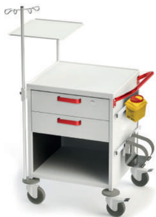
TM-10 (для скорой помощи)