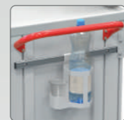
Держатель бутылки и стаканов для воды