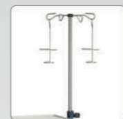
Стойка инфузионная (кроме TM 1, 2, 8, 9)