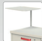
Стол приборный поворотный