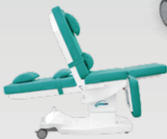
Изменения положений панели