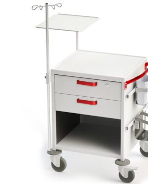
TM-10 (для скорой помощи) 509.409 Габариты (д/ш/в): 780x655x890 мм