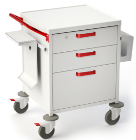
TM-3 (для обхода) 509.402 Габариты (д/ш/в): 780x655x890 мм