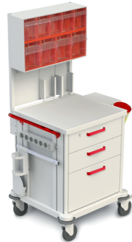
TM-2 (для интенсивной терапии) 509.401 Габариты (д/ш/в): 790x665x1540 мм