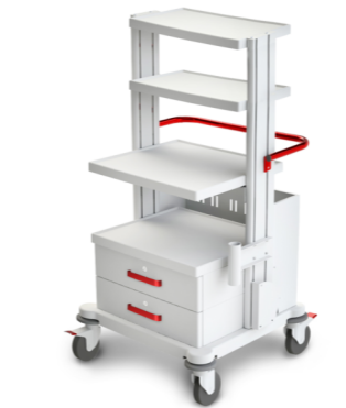
TM-9 (для гинекологического кабинета, приборная) 509.408 Габариты (д/ш/в): 705x665x1335 мм