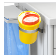
Контейнер для сбора использованного острого инструментария