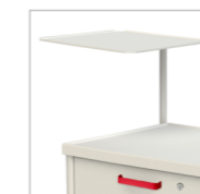
Столик приборный поворотный