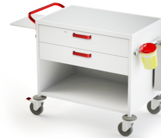
TM-7 (наркозная) 509.406 Габариты (д/ш/в): 1080x655x890 мм