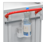
Держатель стаканов и бутылки с водой