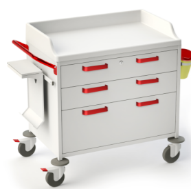
TM-5 (для ухода, перевязок и гипсования) 509.404 Габариты (д/ш/в): 1080x655x950 мм