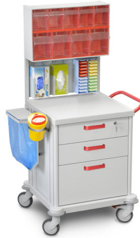
TM-1 (процедурная) 509.400 Габариты (д/ш/в): 790x665x1540 мм