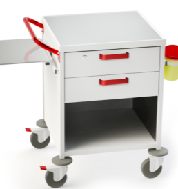
TM-6 (наркозная) 509.405 Габариты (д/ш/в): 780x655x890 мм