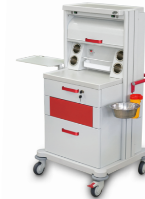
TM-8 (для гинекологического кабинета, инструментальная) 509.407 Габариты (д/ш/в): 705x665x1305 мм