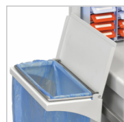
Держатель полиэтиленового мешка