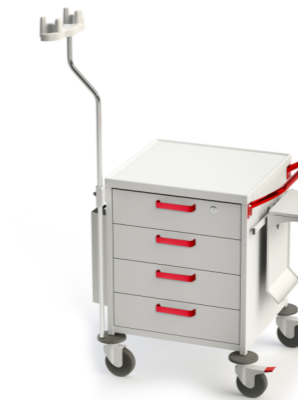
TM-11 (эндоскопическая) 509.410 Габариты (д/ш/в): 780x655x890 мм