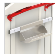
Держатель для полотенца