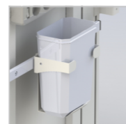
Контейнер для отходов