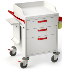
TM-4 (для гипсования) 509.403 Габариты (д/ш/в): 780x655x950 мм